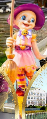
มหาลัยหญิงอีวา