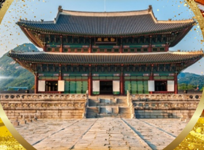
พระราชวังเคียงบกกรุง

EASTAR JET / t'way 이스타항공 เดินทาง ต.ค. - พ.ย. 67 น้ำหนัก 20 Kg. Carry on 10 Kg.