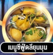
เมนูซีฟู้ดลิ้นจี่