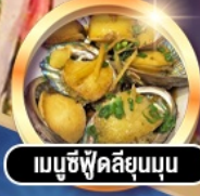
เมนูซีฟู้ดลิ้นยุบนุ่ม