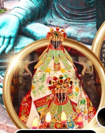
ยืมเงินเจ้าแม่กวนอิมสองห้า