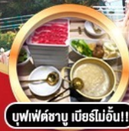
บุฟเฟ่ต์ชาบู เมียร์โมอัน!!