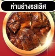
ห่านย่างรสเลิศ