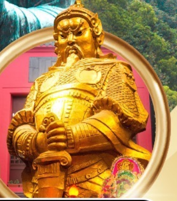
วัดเขกงหมิว