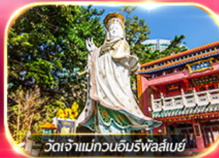
วัดเจ้าแม่กวนอิมรพาสลิมย์