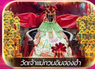
วัดเจ้าแม่กวนอิมสองอ่า