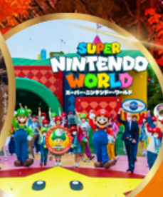
อิสระ UNIVERSAL STUDIO