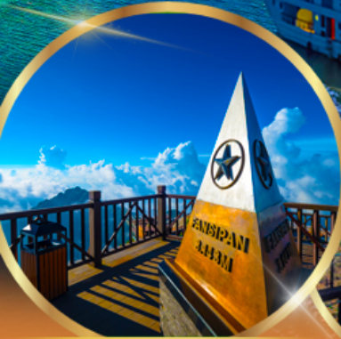
ยอดเขาฟานซีปัน

พักโรงแรม ★★★★★ GRAND SILK PATH SAPA HOTEL 2 คืน ROYAL CASINO HALONG HOTEL 1 คืน