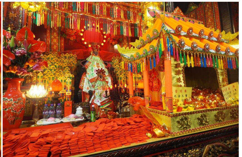
แถมฟรี แผ่นทองเจ้าแม่กวนอิม ประธานพรโชคลาภ เงินทอง