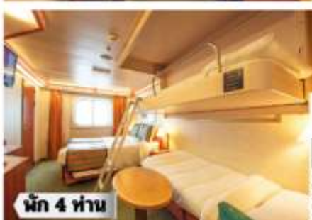
Floor Diagram Oceanview Sleeps up to 4 321 Cabins Cabin: 291 sqft (28 m 2 ) * Size may vary, see details below.

ห้องพรีเมียมจะมี Location ดีกว่า เช่น ชั้นสูงกว่าห้องคลาสสิก และ สามารถ เลือกรับ อาหารเช้าได้