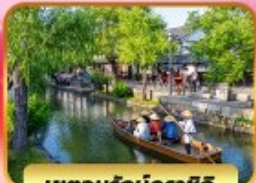
เบตอบุรูกบคุราชิกิ