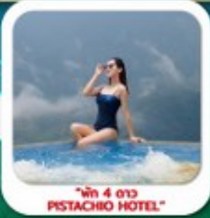
"พัก 4 ดาว PISTACHIO HOTEL"