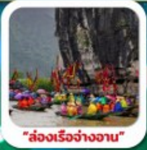
"ส่องเรือจ้างฮาน"