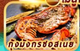
กุ้งมังกรชอสนาย