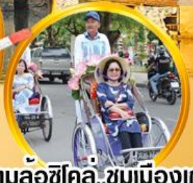
สามล้อซิคิลี่ ชมเมืองเก่า