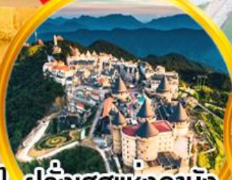
ฝรั่งเศสแห่งดานัง