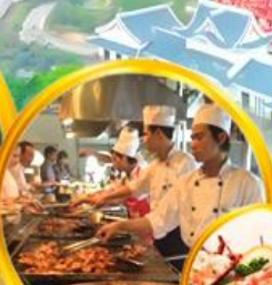
บุฟเฟ่ต์นานาชาติ