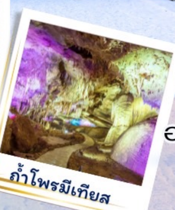
ถ้ำไฟรมีเทียส