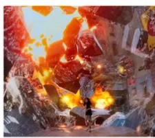
SPACE & TIME CUBE