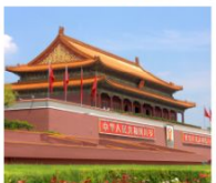
เทียนอันเหมิน

ทัวร์คุณธรรม ไม่ลงร้านช้อปปิ้ง • ไม่ขายออฟชั่น