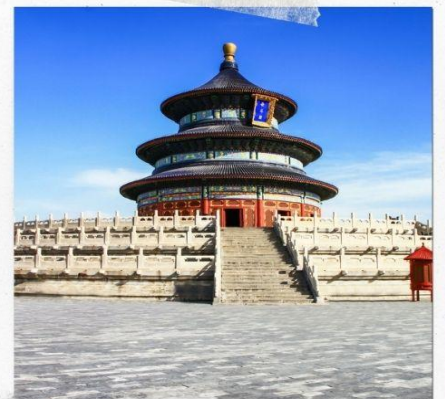
หอบูชาเทียนถาน