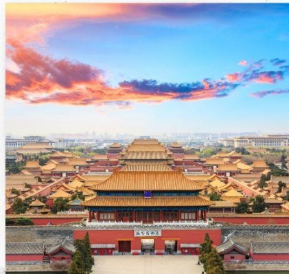
พระราชวังกู้กง