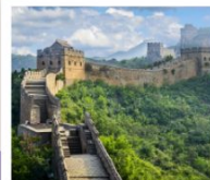
กำแพงเมืองจีน