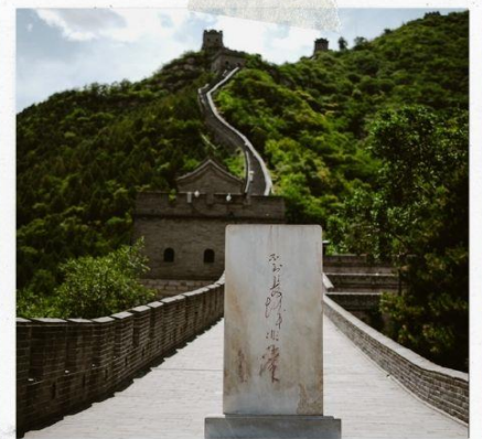
กำแพงเมืองจีน ด่านจวิหยงกวน