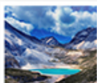
ทะเลสาบน้ำนม