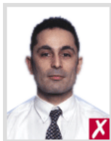
ใกล้เกินไป