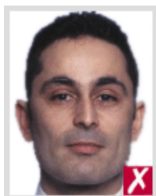
ใกล้เกินไป