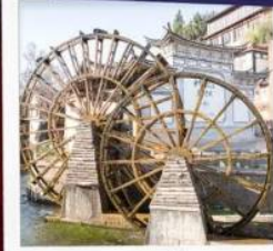
เมืองเก้าลี่เจียง