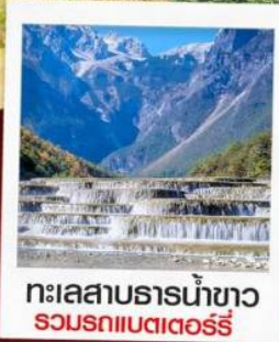
ทะเลสาบธารน้ำขาว รวมรถแบริดเตอร์รี่