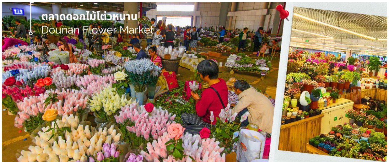
ตลาดดอกไม้ไต้หวัน Dounan Flower Market

นำท่านชม ตลาดดอกไม้ไต้หวัน เป็นตลาดค้าส่งดอกไม้ที่ใหญ่ที่สุดของจีน เปิดทำการค้าตลอด 24 ชั่วโมง ไม่มีช่วงเวลาปิดทำการ โดยในปี 2566 ตลาดดอกไม้ไต้หวันมีปริมาณการซื้อขายดอกไม้โดยเฉลี่ยรวม 13,540 ล้านบาท คิดเป็นมูลค่า 13,570 ล้านบาท ถือเป็นตลาดค้าปลีก-ส่ง ผลิตผลทางการเกษตรที่ใหญ่ที่สุดในประเทศจีนอีกด้วย