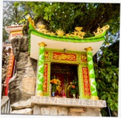
ศาลเจ้าติงซาอว