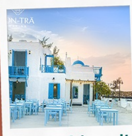
ซานตารีนาคาเฟ่