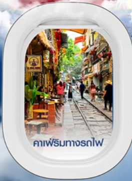
คาเฟ่ริมทางรถไฟ