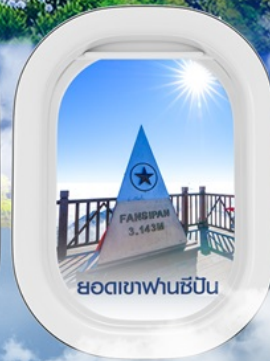
ยอดเขาฟานซิปิน

✈️ คอนเฟิร์มออกเดินทาง ✈️ ทุกพีเรียด 2 ท่านขึ้นไป