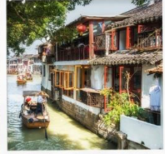
เมืองโบราณจูเจียวเฉียว