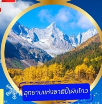
อุทยานแห่งชาติปี้เฟิงโกว