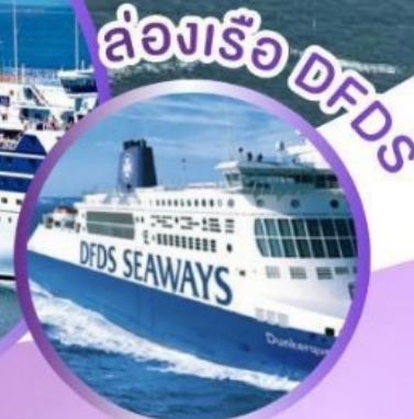
ล่องเรือ DFDS