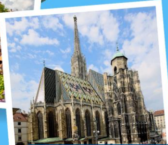
มหาวิหารแมททีอัส

เยอรมนี ออสเตรีย เชก สโลวาเกีย ฮังการี 11 วัน 8 คืน