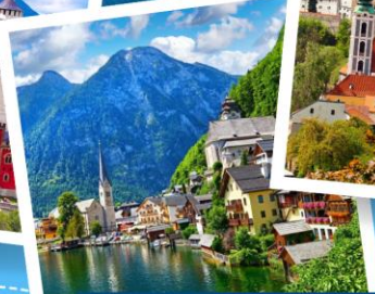
เมืองฮอลสตัดท์