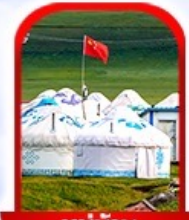
หมู่บ้าน พื้นเมือง