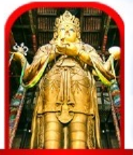
วัดกานดา