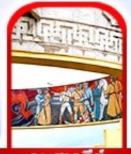
อนุสาวรีย์ โซซาน