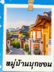
หมู่บ้านนูกซอน