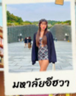
มหาชัยชีวา