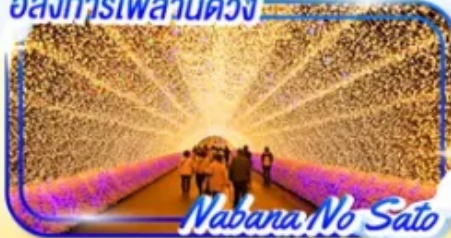
Nabana No Sato