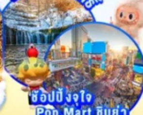
ช้อปปิ้งจ๊อ Pop Mart ชิบูย่า

📍 ไฮไลท์!! อสังการไฟลันดวง ณ หมู่บ้านนาบานะ โนะ ซาโตะ น้ำตกชิราอิโตะ น้ำตกศักดิ์สิทธิ์และซันกะเมียนเป็นมรดกโลก เยี่ยมชมหมู่บ้านเกษตรกรรม พิพิธภัณฑ์หมู่บ้านอียาชิโนซาโตะ ย่านชิบูย่า ศูนย์กลางติวยอคนิยมของวัยรุ่น อนุสรณ์รูปปั้นของสุนัขฮาจิโกะ