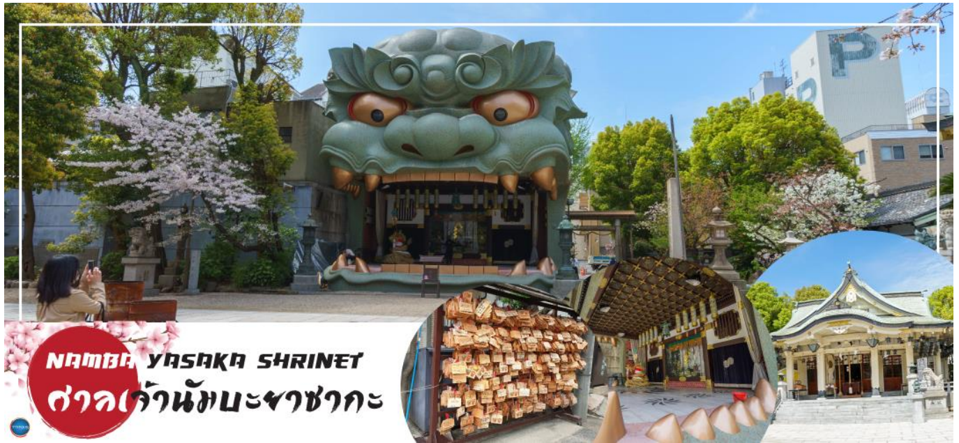
NAMBA YASAKA SHRINE ศาลเจ้านัมมะยาซากะ

วันที่สี่ เมืองโอซาก้า – ศาลเจ้านัมมะยาซากะ – ตลาดคุโรมง – Mitsui Shopping Park LaLaport Sakai – ห้างอ็อน มอลล์ ริงกุเซนนัน – ท่าอากาศยานนานาชาติคันไซ – ท่าอากาศยานนานาชาติดอนเมือง