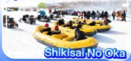
Shikisai No Oka