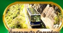
นั่งรถรางชมวิว เมืองเบอร์เกน