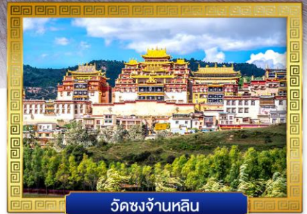
วัดชงจ้านหลิน