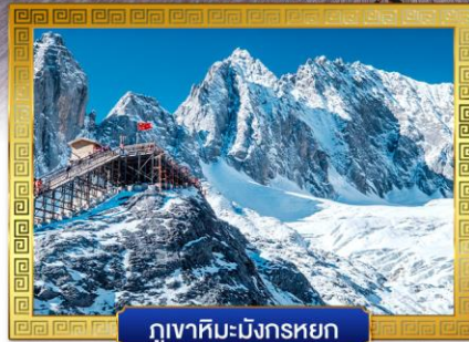
กุเวาหิมะ-มังกรหยก