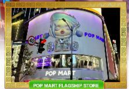
POP MART FLAGSHIP STORE