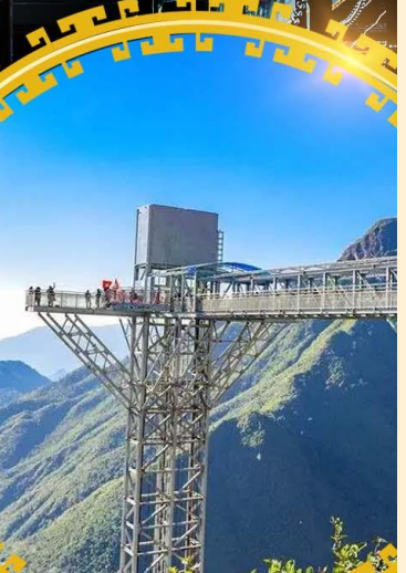
สะพานแก้วมิงกรเมซ