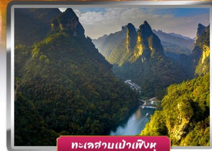
ทะเลสาบเป่าเฟิ่งหู