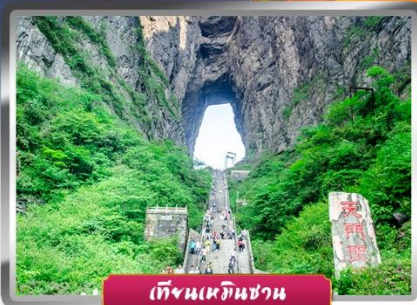
เทียนเหมินชาน