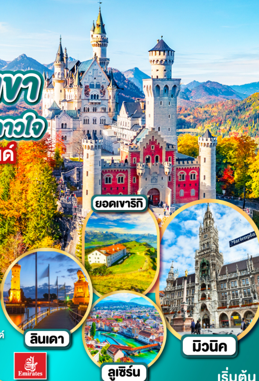
ยอดเขารีกี