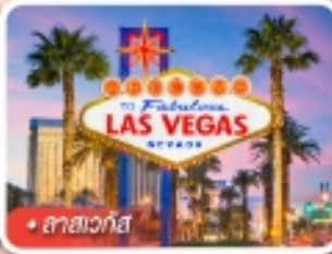
ลาสเวกัส