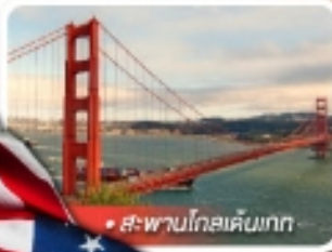
สะพานโกลเด้นเกต