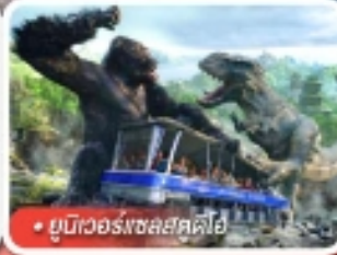
ยูนิเวอร์สอลสตูดิโอ