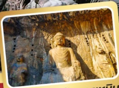
พลาแคะสลักหลงเหมิน