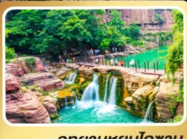
อุทยานหยุ่นโกซาน