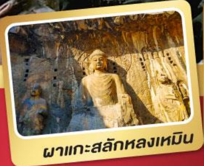
ผาแกะสลักหลงเหมิน