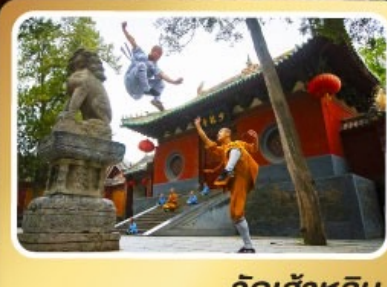
วัดเส้าหลิน