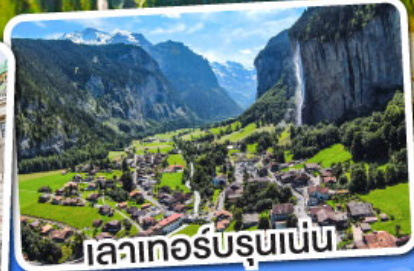
เลาเกอร์บรุนเนน