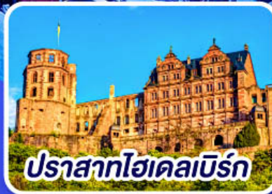
ปราสาทโฮเดลเบิร์ก