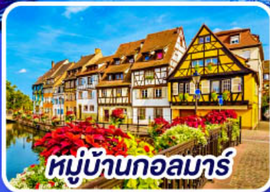
หมู่บ้านกอลมาร์