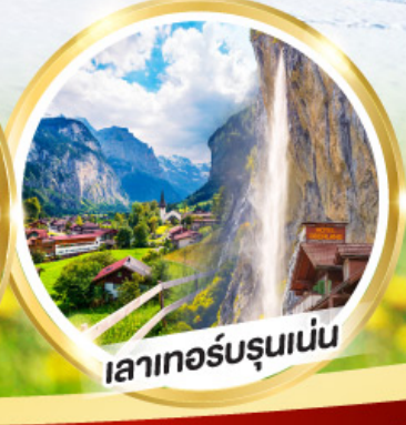
เลาเทอร์บรุนเนน