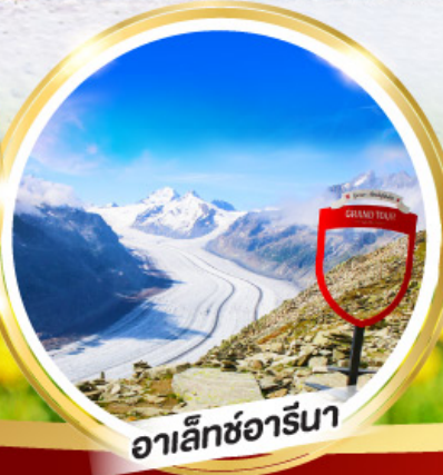
อาเล็กซ์อาร์นา