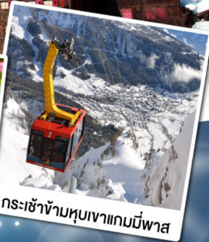
กระเช้าข้ามหุบเขาเกมมีพาส

18-24 ก.พ. 68 11-17 มี.ค. 68 29 เม.ย.-05 พ.ค. 68