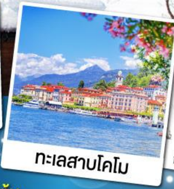
ทะเลสาบโคโม