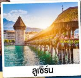
ลูเซิร์น

ณ เมืองอุคเคอร์แบค เมืองแห่งน้ำแร่สวิตเซอร์แลนด์