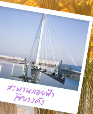
สะพานลอยฟ้า โซฮางคัง