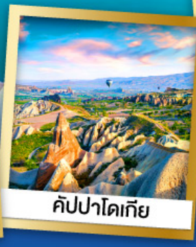
คัปปาโดเกีย