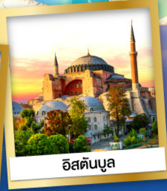
อิสตันบูล