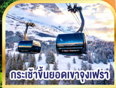
กระเช้าขึ้นยอดเขาจุงเฟรา