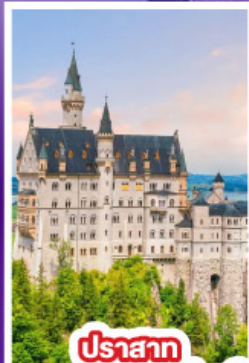
ปราสาท นอยชวานสไตน์