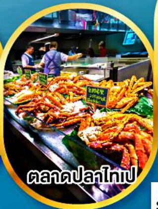
ตลาดปลาไทเป