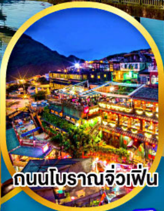
ถนนโบราณจิวเฟิ่น