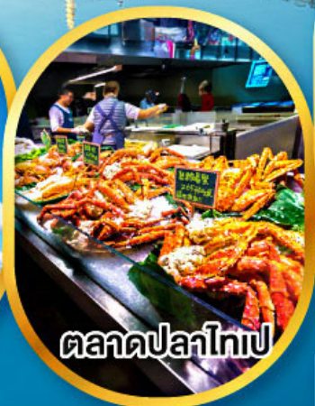
ตลาดปลาไทเป